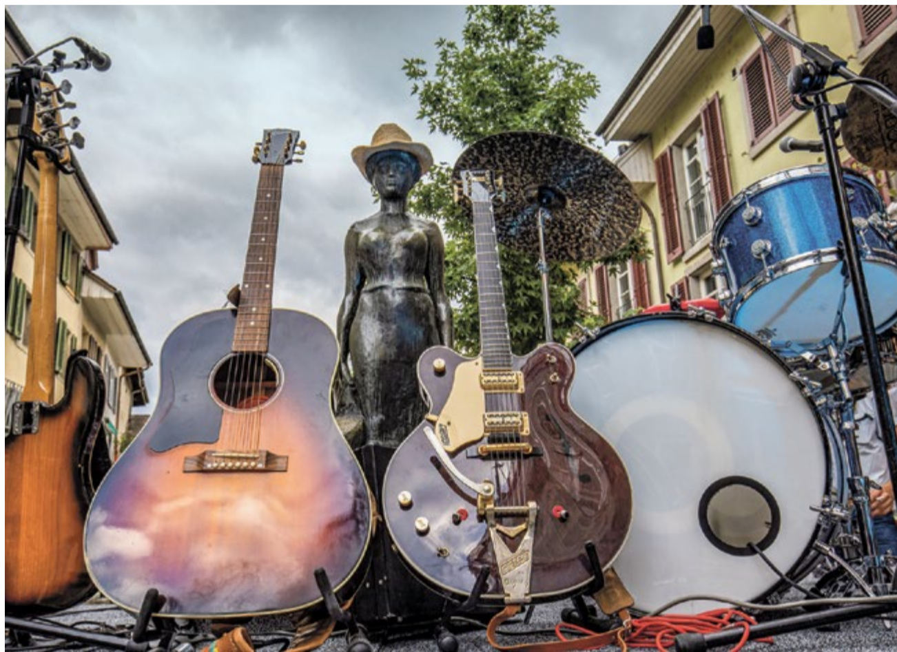
Wie bei den Konzerten im Graben wird auch für das erste August-Wochenende der Brunnen in eine Konzertbühne umgewandelt.