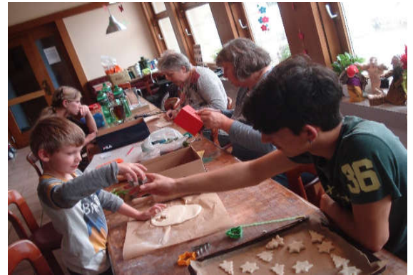
Basteln im Vorstädtli

Braucht es ein Generationenhaus im Thal oder nicht? Mit dieser Frage sind wir ins Jahr 2019 gestartet. Im Kontakt mit regionalen Institutionen, Ärzten und Therapeuten haben wir das Vorstädtli vorgestellt und im April auch an der Seniorenmesse in Oensingen unser Angebot präsentiert. So haben wir auch unsere Website einem Facelifting unterzogen. Wenn Sie die Website noch nicht besucht haben, müssen Sie unbedingt mal zugreifen.