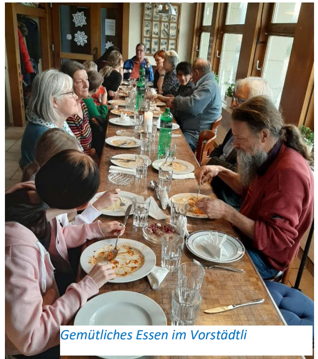
Gemütliches Essen im Vorstädtli

Ein grosser Dank gebührt meinen Kolleginnen- und Kollegen aus dem Vorstand, insbesondere für Ihre wertvolle Arbeit zwischen den Sitzungen. Die heutige Zusammensetzung des Vorstandes ist sehr gut; das Team ist eingespielt und arbeitet effizient. Trotzdem sind Veränderungen angesagt, hinsichtlich einer Verjüngung sowie einer besseren, lokalen Vernetzung in der Region Thal.