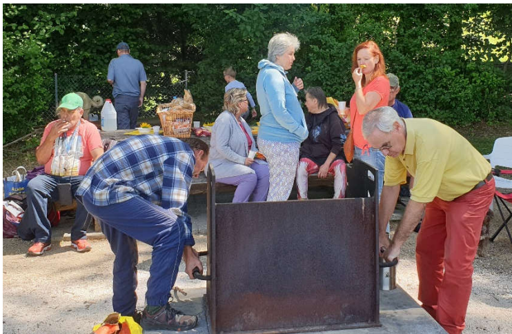
Grillieren auf dem Born

Im Sommer konnten wir einige Anlässe organisieren. So haben wir auf dem Born grilliert und im Garten einen Pool aufgestellt, der dann selbstverständlich mit einer Sommerparty eingeweiht wurde.