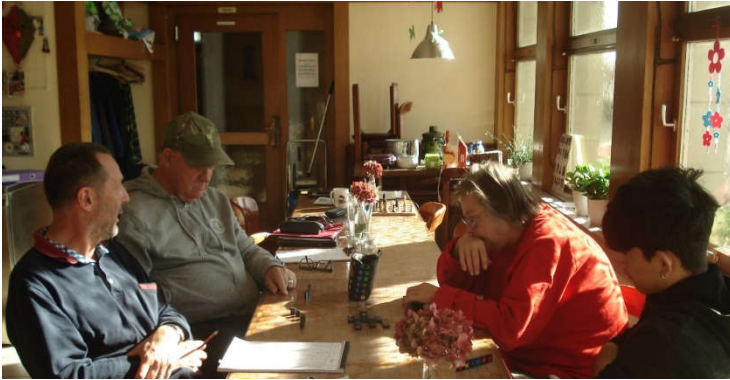
Spiele im Vorstädtli

Braucht es ein Generationenhaus im Thal oder nicht? Mit dieser Frage sind wir ins Jahr 2019 gestartet. Im Kontakt mit regionalen Institutionen, Ärzten und Therapeuten haben wir das Vorstädtli vorgestellt und im April auch an der Seniorenmesse in Oensingen unser Angebot präsentiert. So haben wir auch unsere Website einem Facelifting unterzogen. Wenn Sie die Website noch nicht besucht haben, müssen Sie unbedingt mal zugreifen.