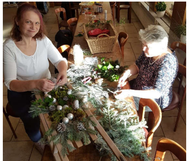
Kreativ im Vorstädtli