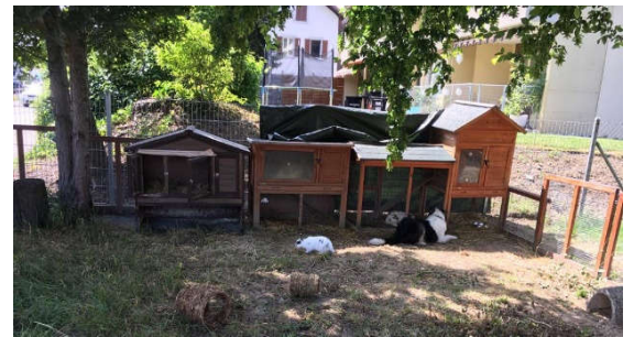
Kaninchen im Garten